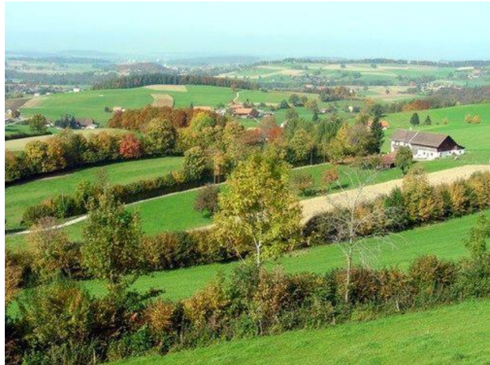
A gauche, allée d'arbres ; à droite, haies