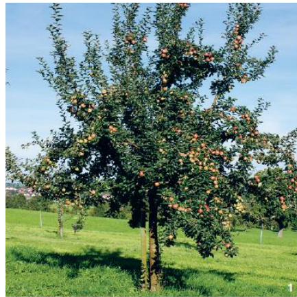
A gauche, verger ; à droite, arbre fruitier haute tige