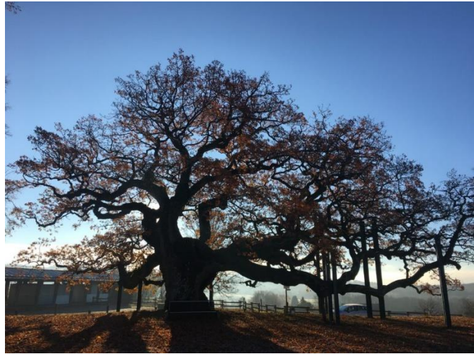
A gauche, arbre isolé ; à droite : arbre remarquable (chêne de Morrens)